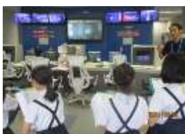
敷根清掃センターの管理室を見せてもらう4年生