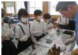
霧島警察署で指紋の採取に挑戦する3年生

6年生が、安良小学校の5、6年生と合同で修学旅行へ行きました。ホテルで楽しく過ごしたり、知覧特攻平和会館で平和の大切さについて学んだり、豪華な夕食をみんなで食べたり、遊園地で遊んだりと楽しい2日間を過ごすことができました。来年、横川中で一緒になる子たちともとても仲良くなったようです。すてきな思い出がまたひとつ増えました。