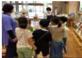
栗野図書館のお仕事を体験する2年生

6年生が、安良小学校の5、6年生と合同で修学旅行へ行きました。ホテルで楽しく過ごしたり、知覧特攻平和会館で平和の大切さについて学んだり、豪華な夕食をみんなで食べたり、遊園地で遊んだりと楽しい2日間を過ごすことができました。来年、横川中で一緒になる子たちともとても仲良くなったようです。すてきな思い出がまたひとつ増えました。