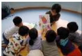
栗野図書館で読み聞かせに夢中になる1年生